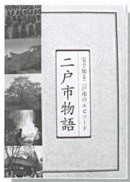
「宝で知る二戸市のエピソード 二戸市物語」

先人の努力によって守られてきた「宝」に触れ、次の世代へと伝えていく一冊。自分たちの暮らしているまちの自然や文化、産業など地域資源である「宝」を、市民総参加で掘り起こした「宝を生かしたまちづくり」。その代表的な宝のエピソードを一冊にまとめました。