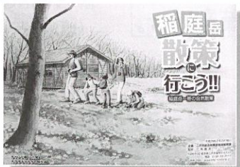
さまざまな植物や昆虫、野鳥に出会える季節を詳しく紹介しています

3年間にわたる稲庭岳自然調査の結果をもとに、稲庭岳一帯の自然散策ガイドマップ「稲庭岳散策に行こう!!」を作成しました。