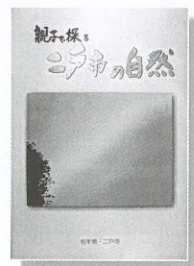
「親子で探る 二戸市の自然」

二戸市には、誇れる自然の宝がたくさんあります。本書では、気候・気象をはじめ、地形と地質、植物、鳥類、昆虫などそれぞれの分野について、豊かな自然を分かりやすく紹介しています。