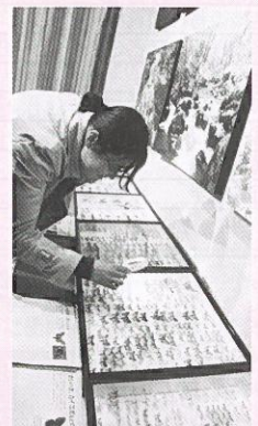
自然のデザインに興味津々

「ヒメギフチョウ」など昆虫類の標本や、「テツギョ」など魚類や両生類の水槽展示、植物、野鳥などの写真パネルに、訪れた来場者は興味深く見入っていました。