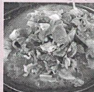
味噌たれジンギスカン