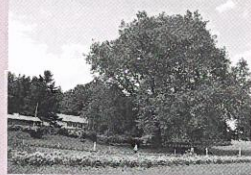
上野のアメリカスズカケノキ