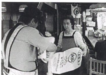
飲酒運転根絶！ご協力よろしく申し上げます

8月4日、二戸市で開催された「二戸ガンバンNIGHT！」に合わせ飲酒運転防止キャンペーンを実施しました。この活動は、平成23年中の二戸警察署管内の居住者の飲酒運転検挙数が21件と前年に比べ13件も増加したことを受け、飲酒運転根絶のために行ったものです。当日はイベント会場で二戸警察署、二戸地区交通安全協会、二戸市交通指導隊が合同で、飲酒運転根絶のためのチラシ配布など広報活動を行ったほか、市内飲食店を訪問し、ハンドルキーパーへの協力を呼びかけました。ハンドルキーパーとは、飲み会などでお酒を飲まず、仲間を送る運転手の役割を担う人のことです。