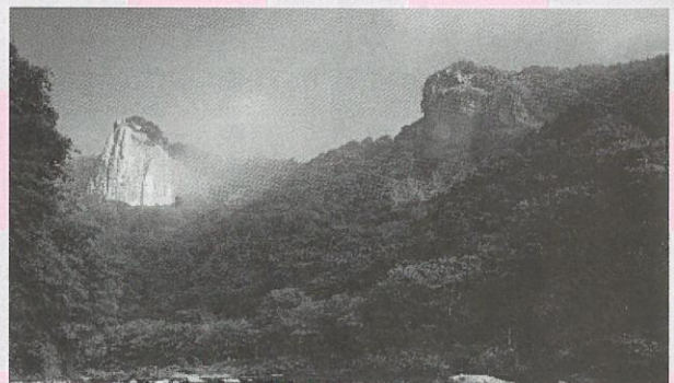
晩秋の男神・女神をウォーキングしてみませんか！