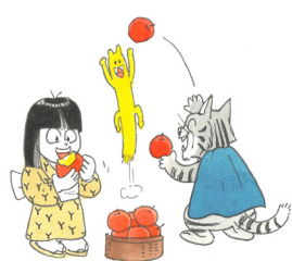
亀磨くんイラスト きり光乗