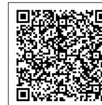
岩手県第2期集団接種について