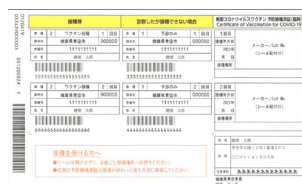
②接種券 (そのままの状態)