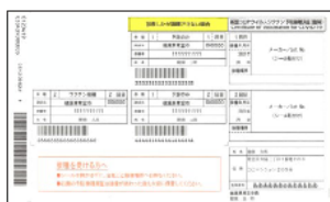
② 接種券 (そのままの状態)