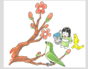
亀唐くん イラスト：きり光乗