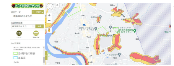
いわてデジタルマップ

自分が住む地域や職場、学校周辺の「土砂災害が発生するおそれのある箇所」を確認し、大雨時に危険な場所を知ることによって災害に備え、いざという時の避難に役立てましょう。