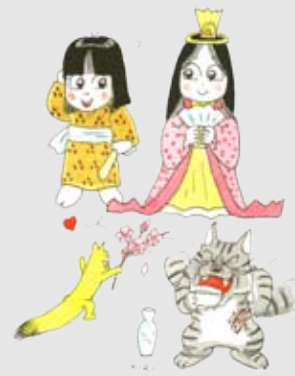
亀磨くん イラスト：きり光乗