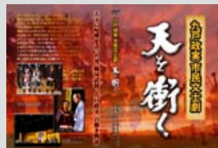
迫力のDVD、BDジャケット

問い合わせ先 二戸地域振興センター（☎23-9201）、政策推進課（内線312）