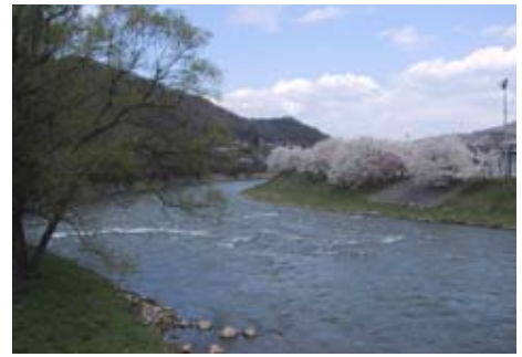
下水道への接続が河川の水質保全につながります

○ 公共下水道が使える区域は 現在、市内で下水道が使える区域は、石切所、福岡、堀野、仁左平、金田一および浄法寺町の各一部です。区域内にお住まいの皆さんに下水道管への接続をしていただくことが、下水道の役割である地域の環境衛生の向上、そして地元の河川である馬淵川などの水質保全につながります。ぜひ、早期の接続をお願いします。