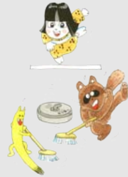
亀磨くん イラスト：きり光乗