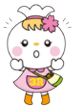
エコロールちゃんも応援しています！