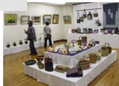
かごやバッグ、絵画などが並ぶ展示室