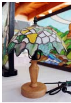
ガラス細工の照明