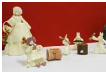
トウモロコシの葉でできたコーン人形