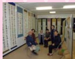
←今年の市文化祭にて。会員の力作を展示しました

とても和やかな雰囲気です。活動しておりますので、みなさんぜひ一度見学にいらしてください。初心者、初級の方々大歓迎です!