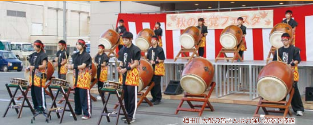
梅田川太鼓の皆さんは力強い演奏を披露