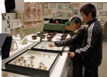
虫の標本にくぎ付け