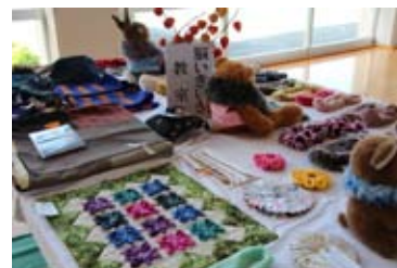
サークル活動の作品