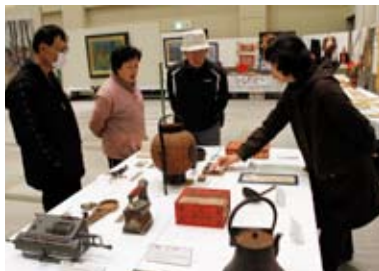
浄法寺歴史民俗資料館の企画展「ちょっと昔の“浄法寺”」