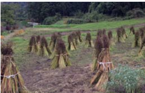
手刈りで蕎麦しまを作りました。食べるのが楽しみです