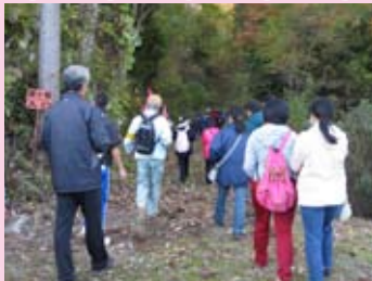
いざ！難所・蓑ヶ坂へ

昼食には郷土料理のひつつみを堪能し、地域の文化や歴史を肌で感じた一日となりました。