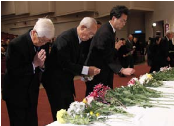
戦没者の冥福を祈り、手を合わせる遺族ら

地元の手工芸を一堂に集めた展示販売会「第4回二戸の工芸手仕事展」(二戸市ふるさと振興(株)主催)は11月15～17日、なにゃーとメッセホールで開催され、多くの家族連れらがものづくりの技に触れました。二戸地域のほか洋野町、青森県南部町などから15社が出展。竹細工、裂き織りなどの制作実演が来場者の目を引いたほか、五角ばしづくりやステンドグラスのアクセサリ作りなどの体験コーナーも人気を集めました。