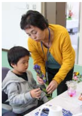
ペットボトルで作った花瓶に生け花体験