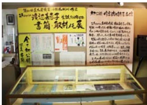
本市ゆかりの直木賞作家渡辺喜恵子さんの生誕100年を記念した「書簡・取材メモ展」