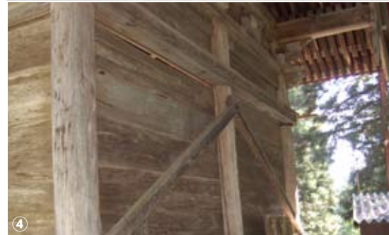
年度内に改修工事が着工する①天台寺本堂、②仁王門 ③礎石が割れ、柱が完全に浮き上がっている(本堂) ④壁板に隙間が生じている(仁王門)