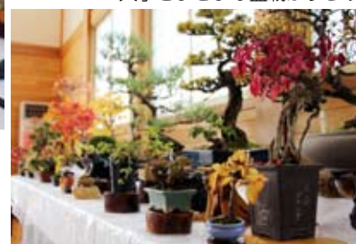
大小さまざまな盆栽がずらり