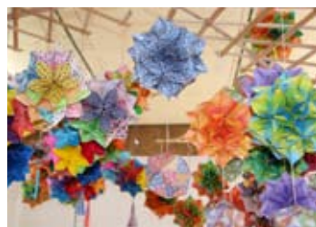
折り紙のつるし飾り