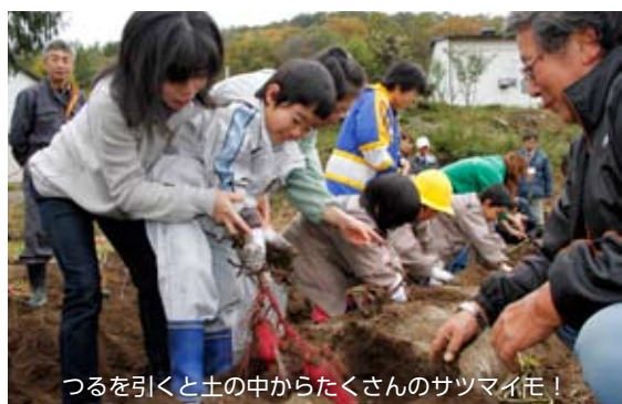
つるを引くと土の中からたくさんのサツマイモ！