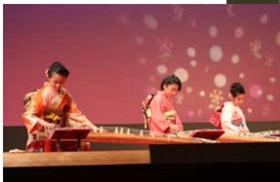
右) 華麗な日本舞踊で観客を魅了 下) 美しい琴の音色が響きました