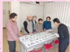
→勉強会ではお互いに意見を出し合い切磋琢磨しています