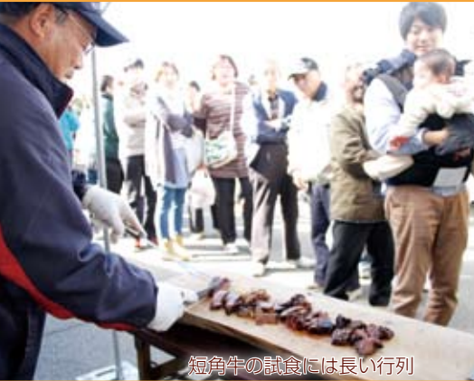
短角牛の試食には長い行列