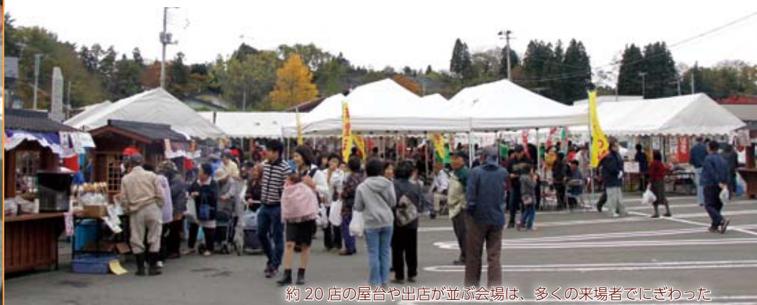
約20店の屋台や出店が並び会場は、多くの来場者でにぎわった

毎年人気の「短角牛即売会」では、市場価格より安く販売される短角牛を求めて長蛇の列ができました。また会場では、餅つきやわんこそば大会、など多彩なイベントが行われ、訪れた家族連れらで一日中にぎわいました。