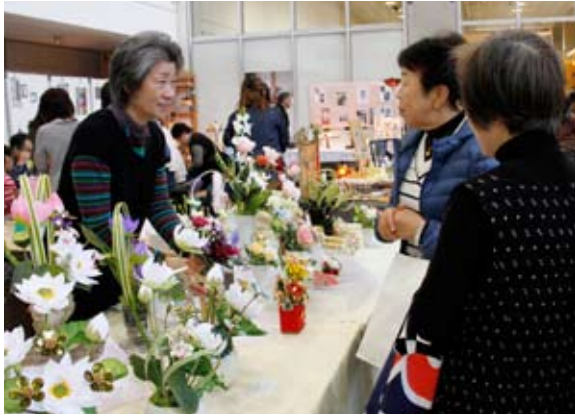
来場者に作品PRする出店者