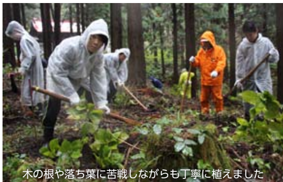
木の根や落ち葉に苦戦しながらも丁寧に植えました