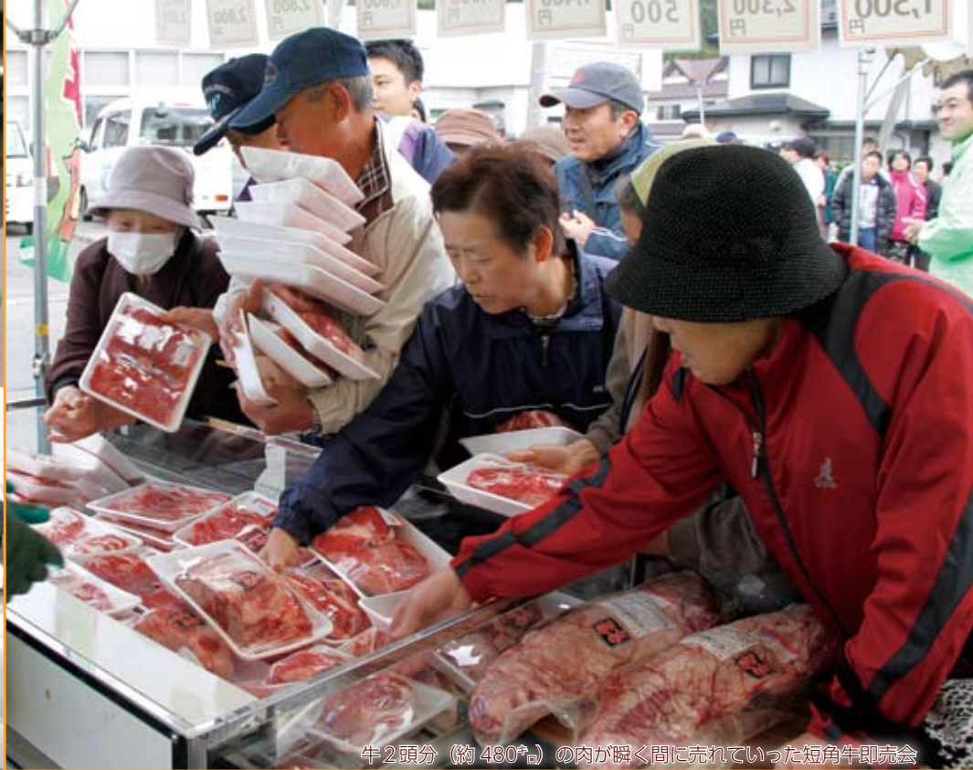
牛2頭分（約480g）の肉が瞬間に売れていった短角牛即売会